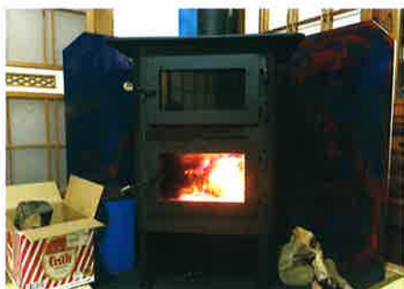
(持続化補助金で導入した薪ストーブ)

今後もこのアトリエから数多くの芸術が生み出され、日本のど真ん中から世界に向けて発信されていくことでしょう。