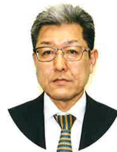
辰野町商工会会長