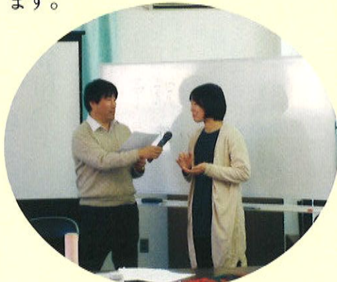
創業塾予祝インタビューの様子

今後もこの創業塾を創業支援の核として継続実施し、ここで培った創業支援のノウハウを個別支援に活かしてまいります。