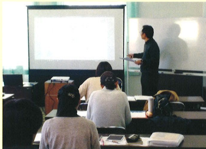
創業塾ビジネスプラン発表の様子