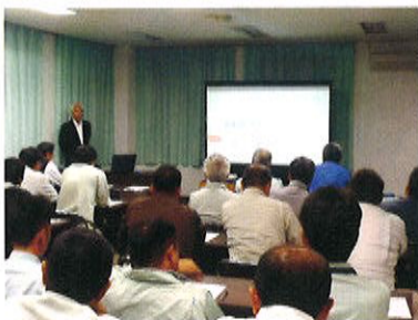
労働災害防止講習会