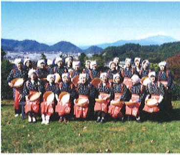
令和元年視察研修

一つでも女性部活動を増やしたいと計画しましたが大成で、今後も継続する方向で検討していきたいと思