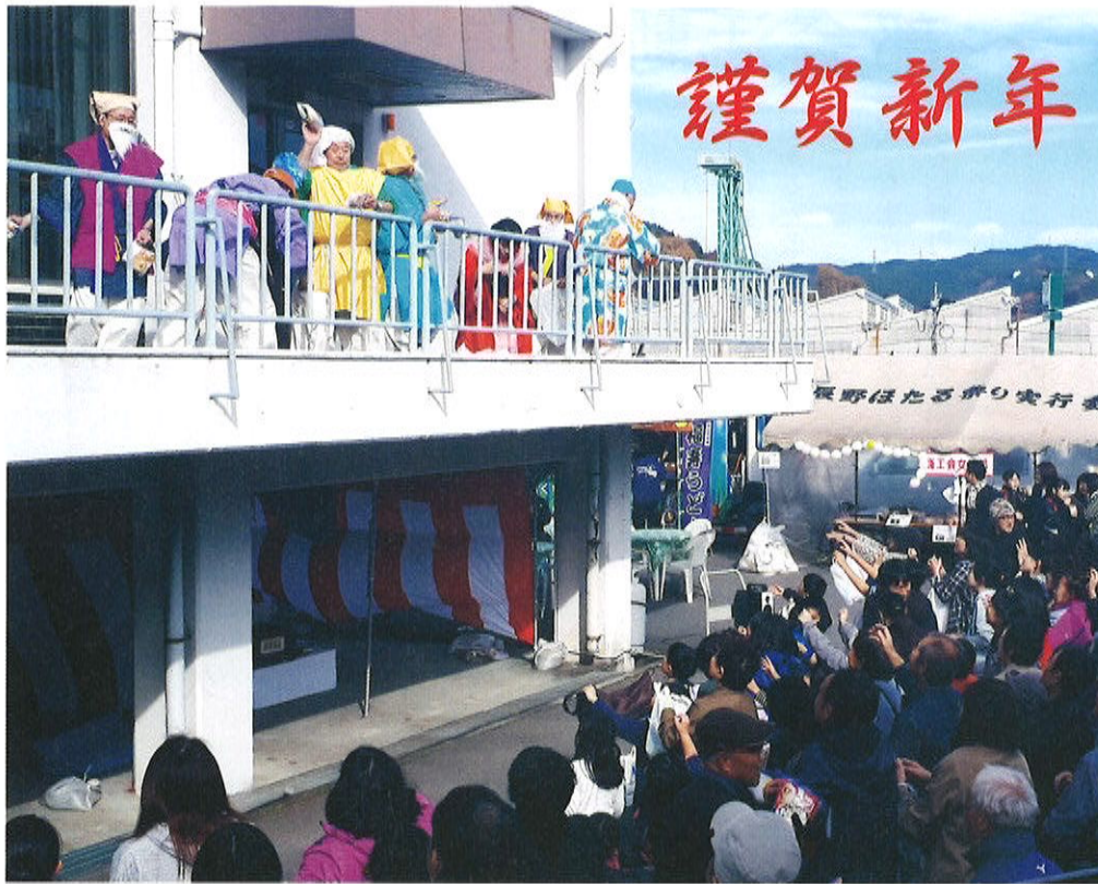
えびす講宝投げの様子