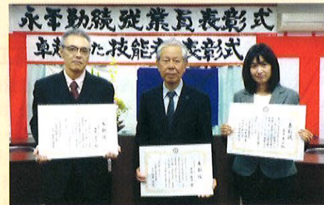
従業員表彰代表者、卓越した技能者