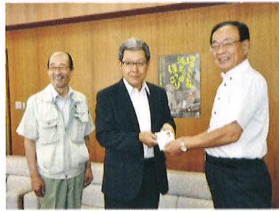
商工会ゴルフコンペ寄付