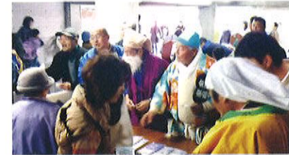
えびす講のようす

段・マドレーヌの販売等新たな参加もあり昨年以上に盛り上がりのあるイベントであったと感じました。