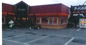
▶レストランテミラノ 上伊那郡辰野町中央606-1