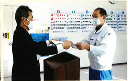
匠名工 表彰状贈呈の様子