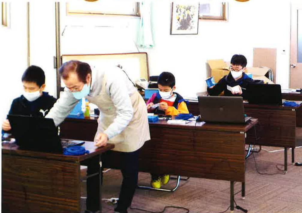
こどもものづくり教室の様子