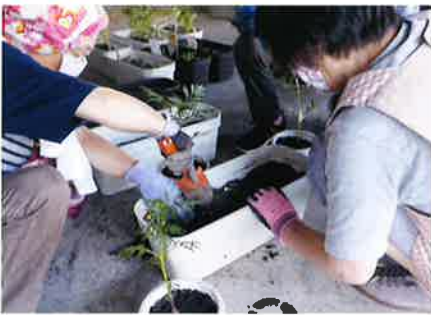
商工会法施行60周年記念事業 花いっぱい運動の様子

年末のフラワーアレンジメント講習会は来年がいい年になってほしいとの期待を込めて対策をした上で実施しました。