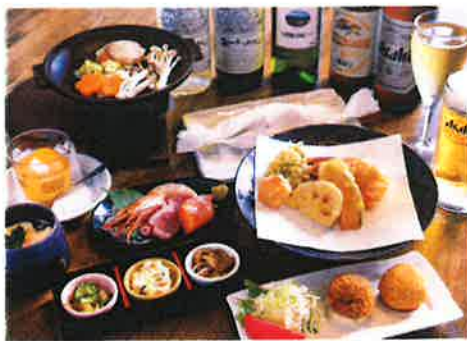
※季節により料理内容は変更となる場合がございます。

※料理・ご予算などお気軽にご相談ください。 ※宴会は3日前までにご予約下さい。 ※事前に連絡があれば、送迎OK(12名まで)。