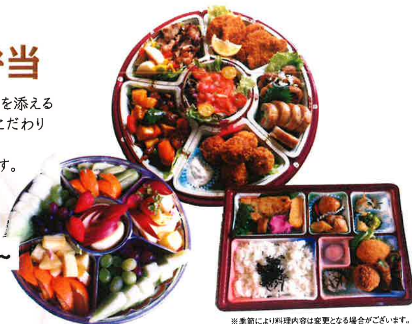
※季節により料理内容は変更となる場合がございます。