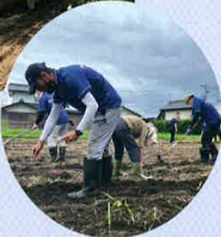
畑の整備や種まき作業