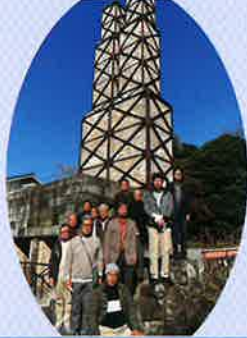
伊豆への視察研修