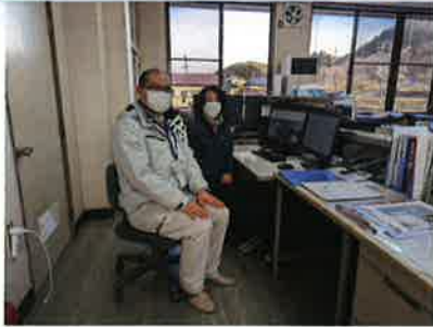
商工会職員による支援の様子

現在デンコー様のホームページは既に完成しており、検索してすぐに見ることが出来ます。デンコー様の特色が出た魅力的なホームページを全世界に向け発信しています。ご自身での更新も簡単に行うことができ、今後も最新の情報を発信することで、営業等に大いに役立つことが期待されます。ホームページ開設支援キャンペーンにご興味のある方は是非商工会までお問い合わせ下さい。