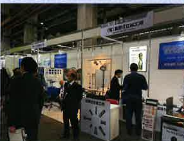
諏訪圏工業メッセ2022