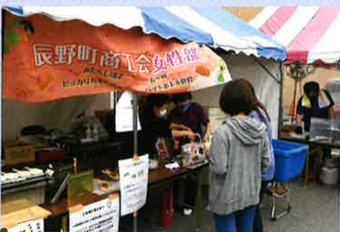
ほたる祭りじもとイチ! 出店

ほたる祭りのじもとイチでは恒例の焼き団子とお祭りには欠かせない餅兄弟の五平餅の販売を行い、予想を上回る売れ行きで大盛況となり、無事完売することが出来ました。 また「コロナ禍で数年間中止になっていた視察研修旅行を今年に行うことができました。行先は石川県。二泊二日の日程で視察を行い、石川県能登鹿北商工会女性部さんと名宿加賀屋さんへ。能登鹿北商工会の女性部さんでは全国商工会女性部連合会が行っている「おもてなし交流事業」を利用し、互いの女性部活動の情報交換や、現地の観光名所の見学などを行いました。おもてなし交流会の中で作ったかおり姫人形はいいお土産です。交流会自体は短い時間でしたが元氣な部長さんにパワーを頂きました。目を肥やし味覚を満喫久しぶりの語り合いの時間が流れていきました。