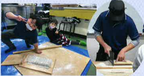
そば打ちや野沢菜漬け