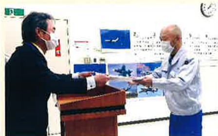
匠名工 表彰状贈呈の様子