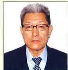
辰野町商工会は 会員企業を支援し 辰野を支えます。

期限内回答にご協力いただきありがとうございました。今後の有効活用に取り組みます。